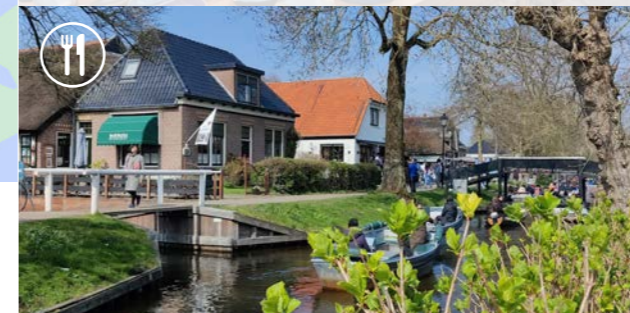
7 Ristorante Fratelli - 4,8 km ⌚ 45 min