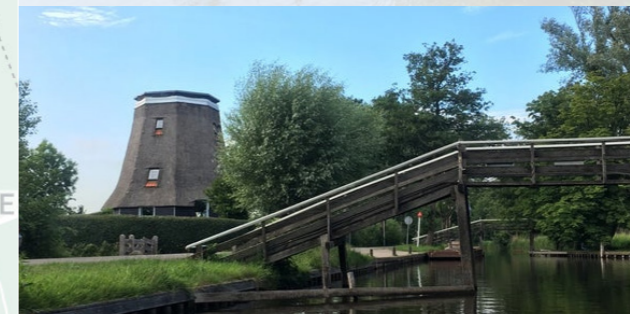
3 Gieterse Koorneule - 6,4km ⌚ 60 min