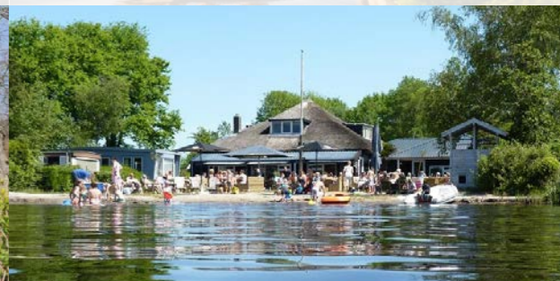
8 Strandpaviljoen Aan 't Wiede - 3km ⌚ 25 min

Die Informationen auf dieser Karte sind unverbindlich, hieraus können keine Rechte abgeleitet werden. Alle Fahrzeiten sind vom Startpunkt aus berechnet.