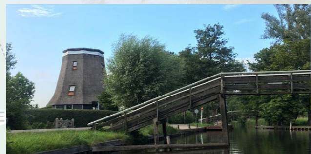
3 Gieterse Koornmeule - 6,4km ⌚ 60 min