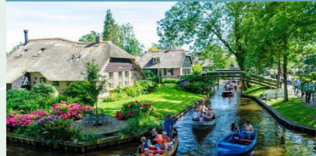
1 Hollands Venetië - 5km ⌚ 45 min