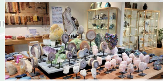
5 Edelstenen museum - 5,4 km ⌚ 45 min