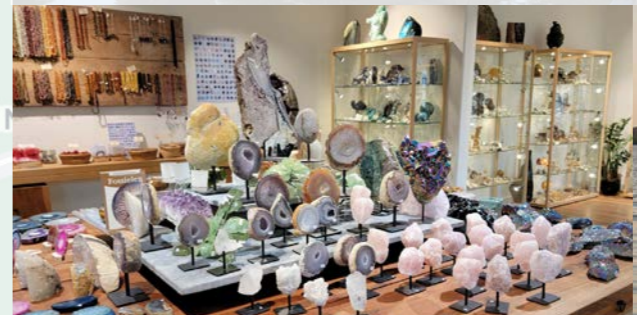
5 Edelstenen museum - 5,4 km ⌚ 45 min