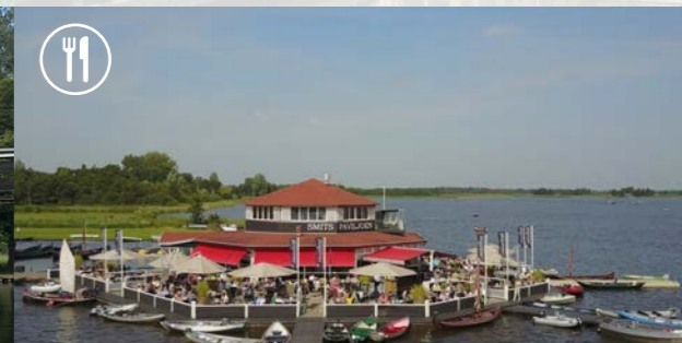
4 Smit's Paviljoen - 6 km ⌚ 55 min