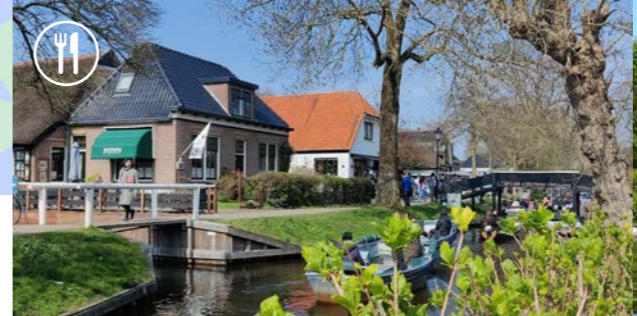
7 Ristorante Fratelli - 4,8 km ⌚ 45 min