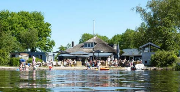
8 Strandpaviljoen Aan 't Wiede - 3km ⌚ 25 min