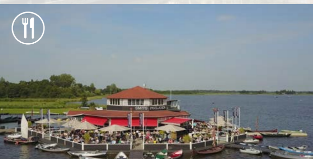
4 Smit's Paviljoen - 6 km ⌚ 55 min