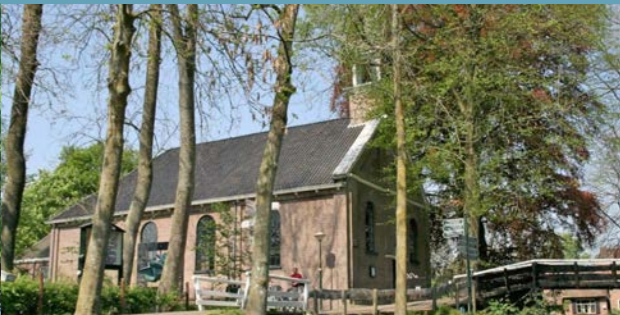
2 Kerk - 5km ⌚ 45 min