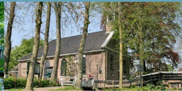
2 Kerk - 5km ⌚ 45 min