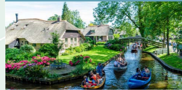
1 Hollands Venetië - 5km ⌚ 45 min