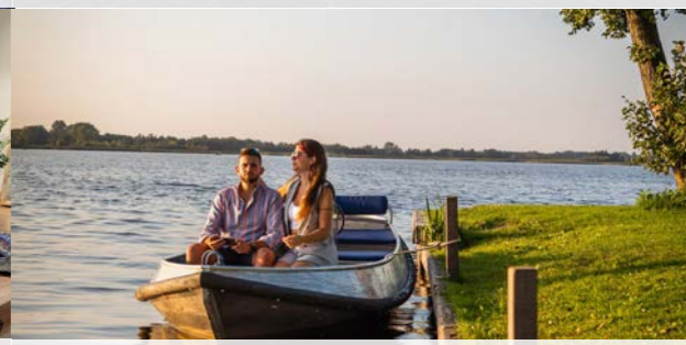
6 Picknick eiland - 6,9 km ⌚ 60 min