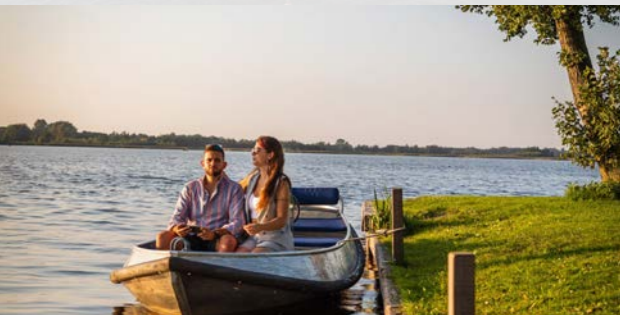
6 Picknick eiland - 6,9 km ⌚ 60 min